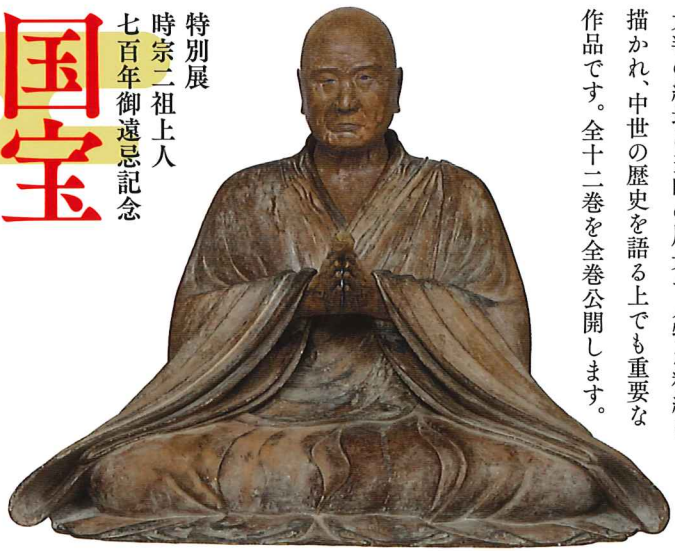
重要文化財 真教上人坐像 神奈川・蓮台寺蔵

遊行や踊り念仏などで知られる時宗は、宗祖一遍上人(1239~89)によって開かれました。この時宗を教団として整備し、大きく発展させたのが二祖の真教上人でした。2019年に真教上人(1237~1319)の七百年遠忌を迎えるのを記念して、時宗の名宝を一堂に会する展覧会を開催いたします。 全国各地を遍歴した一遍の生涯を描いた国宝「一遍聖絵」(清浄光寺蔵)、真教の足跡をつづった「遊行上人縁起絵」、歴代祖師の肖像彫刻や肖像画など、時宗の名宝の全貌をご堪能いただくまたとない機会となることでしよう。なかでも、「一遍聖絵」は鎌倉時代を代表する絵巻で、大判の絹地に当時の風景や人物が精細に描かれ、中世の歴史を語る上でも重要な作品です。全十二巻を全巻公開します。