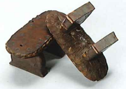
蓮倉形下駄 京都・正法寺蔵