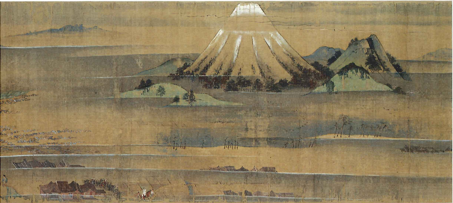
国宝 一遍聖絵 卷六(上)(富士山が描かれた場面)、卷十(下)(厳島神社の伎女の舞) 神奈川・清浄光寺(遊行寺)蔵